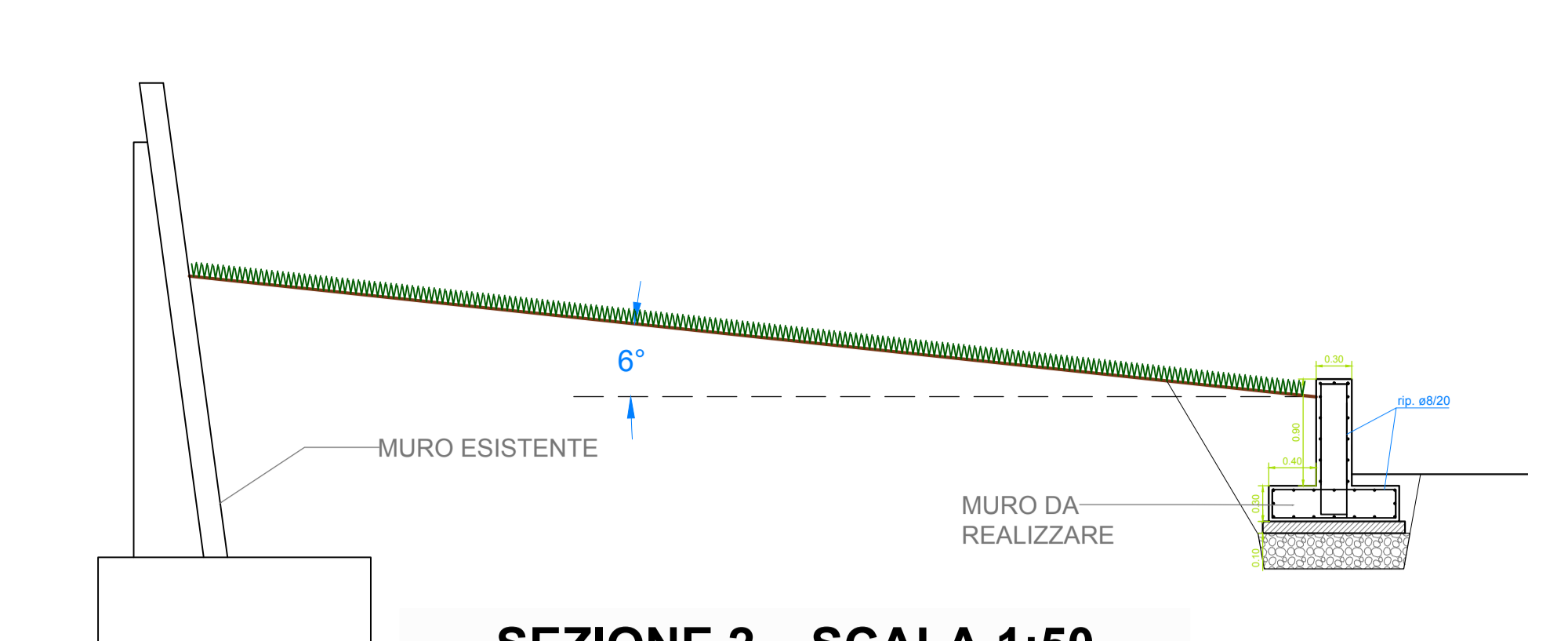
SEZIONE 2 _ SCALA 1:50