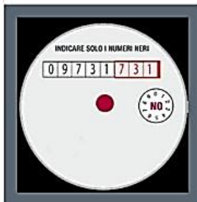
Contatore a lettura diretta

Comunica solo le cifre a sinistra di quelle rosse.