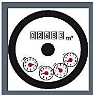
Contatore a lettura diretta.

Comunica, nella tua autolettura, tutte le cifre riportate nel contatore partendo da sinistra verso destra.