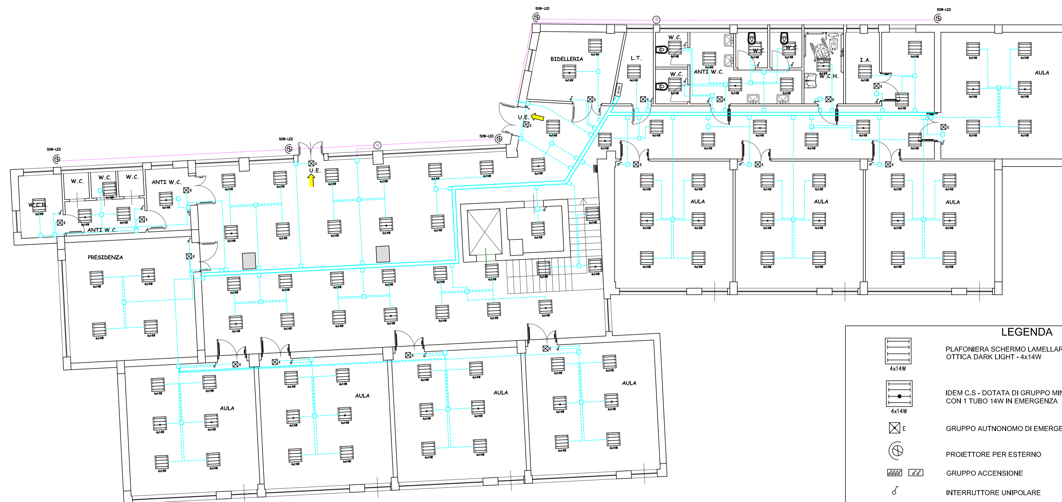
Pianta Piano Primo - Scala 1 : 100