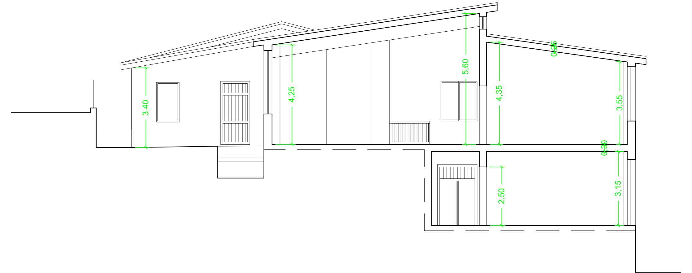
SEZIONE B - B'